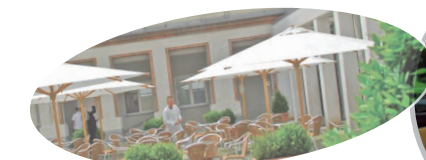
im Restaurant 'Aquino' des Tagungszentrums